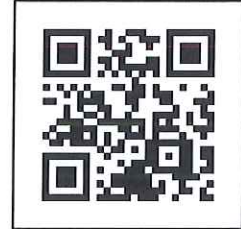
報名連結 QR Code