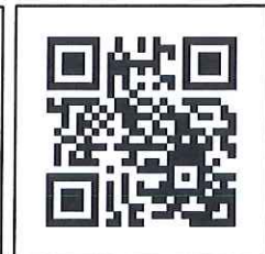
意見調查 QR Code